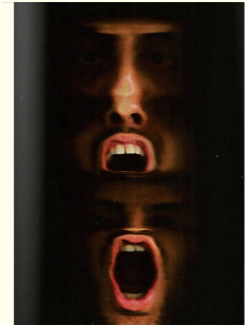
TÍTULO: O gosto do escuro 01 TÉCNICA: Infogravura MATERIAS: Impressão digital sobre malha sintética DIMENSÕES: 100 X 70 cm ANO: 2013