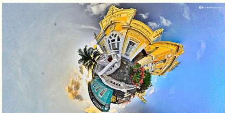
Little planet - Foto360