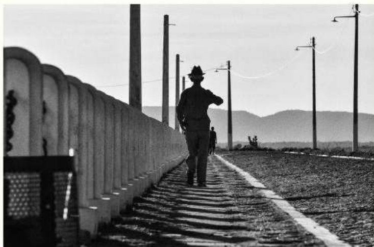
Andando - Salão de Artes do SESC 2013