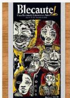
REVISTA BLECAUTE N 12