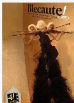
REVISTA BLECAUTE N 13