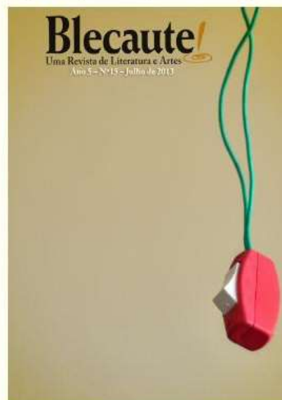
2ª Proposta de capa da Blecaute (não escolhida)

Nos seus trabalhos, Thercles procura desenvolver projetos inovadores na cidade como as fotografias em 360 graus (onde é possível ver a imagem de maneira global), tour virtual (no qual o observador se encontra em estado de imersão na imagem, que pode ser percorrida com movimentos do mouse) entre fotografias artísticas com muita aceitação e premiações em exposições.