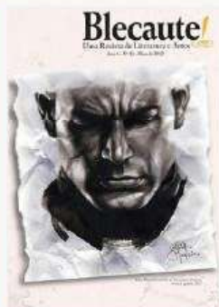
REVISTA BLECAUTE N 11